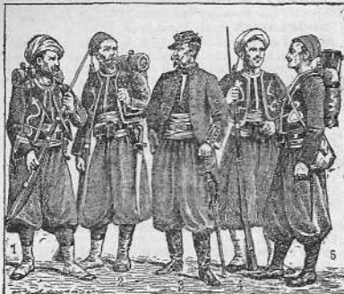
Zouaves : 1. En 1831; 2. En 1854; 3. Officier, en 1854; 4. En 1890; 5. En 1914.

beaux, formés par les tresses rouges sur les côtés de la veste. La couleur était rouge pour le premier