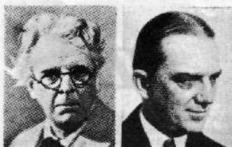
William Butler Yeats. Owen D. Young.

grænsen til Pennsylvania, USA; 168 000 indb. (1940). Jern- og stålindustri.