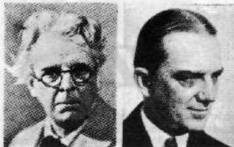
William Butler Yeats. Owen D. Young.

grænsen til Pennsylvania, USA; 168 000 indb. (1940). Jern- og stålindustri.