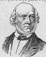
Quatrefages de Bréau.

Quétisme [ ké-té ] (du lat. quies , repos), doctrine mystique, qui fait consister la perfection chrétienne dans l'amour de Dieu et l'inaction de l'âme, sans œuvres extérieures. Le quétisme a eu des représentants à toutes les époques. Son chef le plus connu est le prêtre espagnol Molinos, qui, vers le milieu du xviii e siècle, publia un livre ascétique idéalissant à tel point la religion qu'elle devenait incompréhensible au vulgaire. En France, la célèbre M me Guyon, femme d'une dévotion exaltée, adopta les idées de Molinos et écrivit sur le quétisme. Féné-